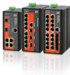
Industrial FE Managed Switch IFS-1604GSM & IFS-803GSM & IFS-402GSM