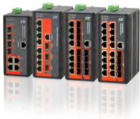
Industrial GbE Managed Switch IGS-1604SM & IGS-812SM & IGS-803SM & IGS-404SM