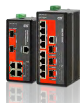
Industrial PoE Managed Switch IFS-402GSM-4PH24 & IFS-803GSM-8PH24

• The specification and pictures are subject to change without notice.