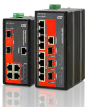
Industrial Gigabit PoE Managed Switch IGS-402SM-4PH24 & IGS-803SM-8PH24